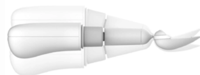
Balanserar bort skakningar