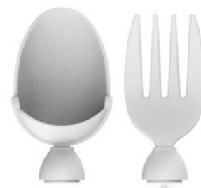
Sked- och gaffelfäste